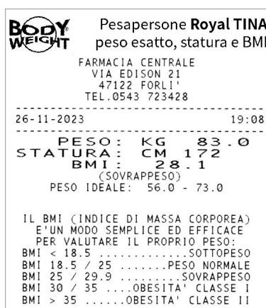
esempio di biglietto